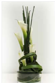
Thekengesteck 04 Glasschale Ø 20 cm, Höhe 50 cm, Calla