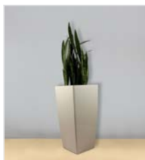
Hochgefäß 09 L 40 x B 40 / H 75 cm – mit Sansevieria laurenti