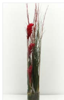
Thekengesteck 12 Glaszylinder Ø 24 cm, Höhe 90 cm, Ingwer