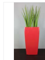
Hochgefäß 06 L 40 x B 40 / H 75 cm – mit Sansevieria mikado