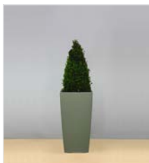
Hochgefäß 14 L 40 x B 40 / H 75 cm – mit Buchs-Kegel