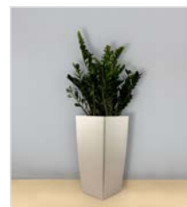
Hochgefäß 11 L 40 x B 40 / H 75 cm – mit Zamiodulca