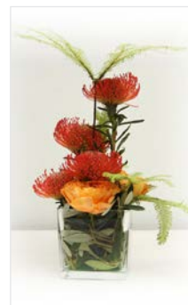
Thekengesteck 01 Glaskubus 15 x 15 cm, Höhe 30 cm, orange