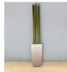
Hochgefäß L 40 x B 40 / H 75 mit Bambusstangen 4 cm, Gesamthöhe 250