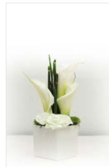
Thekengesteck 07 Kubus weiß 12 x 12 cm, Höhe 25 cm, Calla / Rose