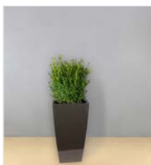
Hochgefäß 08 L 40 x B 40 / H 75 cm – mit Buchs buschig