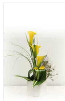
Thekengesteck 13 Kubus, weiß 15 x 15 cm, Höhe 40 cm, Calla gelb