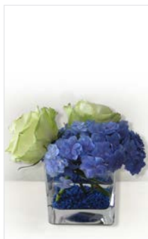
Tischgesteck 19 Glaskubus 15 x 15 cm Höhe 15 cm, Hortensie blau, Rosen weiß