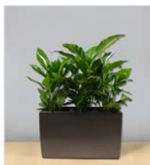
Bodengefäß 02 L 75 x B 30 / H 50 cm – mit Spathiphyllum