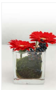
Tischgesteck 02 Glaskubus 10 x 10 cm, Höhe 12 cm, Gerbera