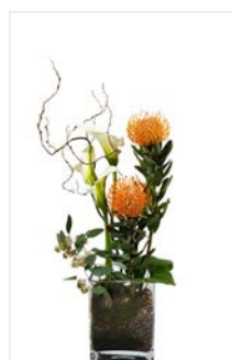
Thekengesteck 18 eckige Glasvase, Protea orange, Calla weiß, Äste, Höhe 65 cm