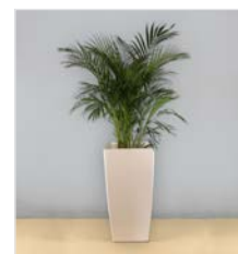
Hochgefäß 12 L 40 x B 40 / H 75 cm – mit Areca-Palme