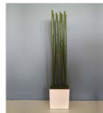
Kubus weiß L 40 x B 40 / H 40 mit Bambusstangen 4 cm, Gesamthöhe 190