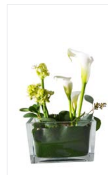
Tischgesteck 16 eckiges Glasgefäß, Calla, Ornithogallum weiß, Beiwerk grün, Kies, Höhe 25 cm