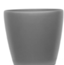
Lechuza Classico, silber matt