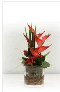
Thekengesteck 06 Glasvase Ø 15 cm, Höhe 40 cm, Caribea