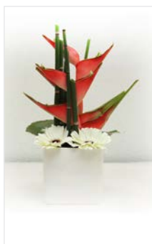
Tischgesteck 13 Kubus weiß 12 x 12 cm, Höhe 25 cm, Caribea + Gerbera