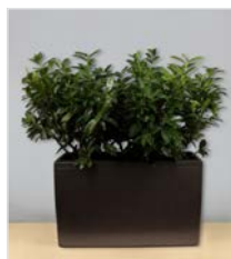
Bodengefäß 03 L 75 x B 30 / H 50 cm – mit Kirschchlorbeer