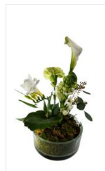
Tischgesteck 15 Glasschale Ø 16 cm, Calla, Ornithogallum, Nelke, Freesie weiß, Höhe 25 cm