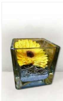
Tischgesteck 08 Glaskubus 10x10 cm, Gerbera gelb, Kies weiß, Höhe 10 cm