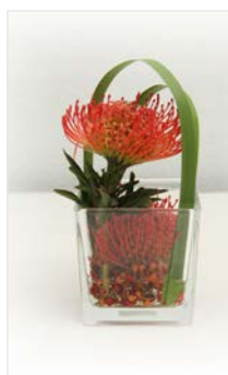
Tischgesteck 03 Glaskubus 10 x 10 cm, Höhe 20 cm, orange