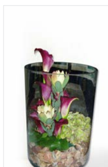
Thekengesteck 17 Glasgefäß Ø 20, Höhe 40 cm, Calla lila, Hortensie, Kies natur