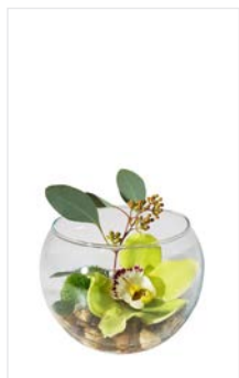
Tischgesteck 18 runde Glasvase Ø 15 cm, Orchideenblüte, Kies natur, Höhe 15 cm