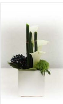
Tischgesteck 11 Kubus weiß 12 x 12 cm, Höhe 20 cm, Calla