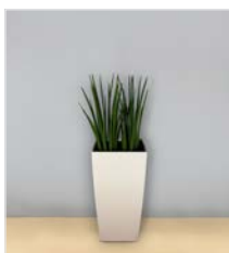
Hochgefäß 07 L 40 x B 40 / H 75 cm – mit Sansevieria mikado