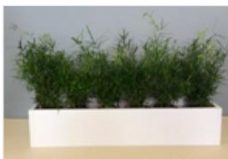
Bepflanzung mit Asparagus falcatus, Höhe ca. 45 cm