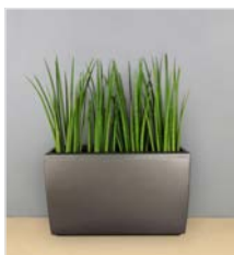
Bodengefäß 01 L 75 x B 30 / H 50 cm – mit Sansevieria mikado