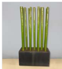
Trog anthrazit L 100 x B 40 / H 50 mit Bambusstangen 9 cm, Gesamthöhe 190