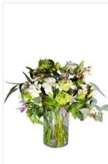
Thekengesteck 03 Blumenstrauß, locker arrangiert, Farbe nach Wunsch, Höhe 50 cm