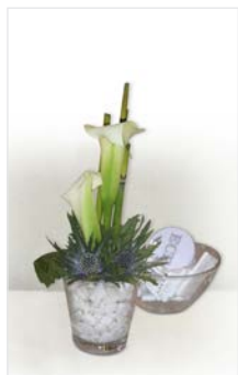
Tischgesteck 07 Glasvase Ø 10 cm, Calla + Kies weiß, Distel blau, Höhe 15 cm