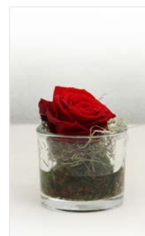
Tischgesteck 05 Glasvase Ø 10 cm, Höhe 10 cm, Rose rot