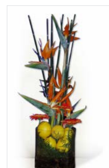
Thekengesteck 20 Glasgefäß Ø 20, Höhe 70 cm, Strelitzie und Zitronen