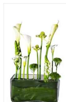
Thekengesteck 19 – läng- liches Glasgefäß, Calla, Hyazinthe weiß, Bartnelke, Beiwerk grün, Höhe 50 cm