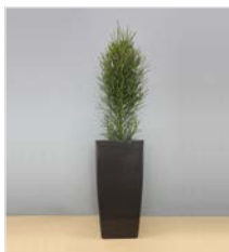
Hochgefäß 13 L 40 x B 40 / H 75 cm – mit Euphorbia tirucalli