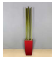
Hochgefäß 05 L 40 x B 40 / H 75 cm – mit Bambusstangen