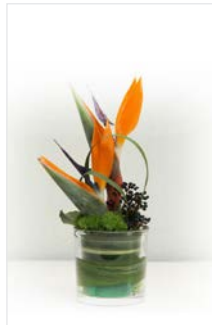
Thekengesteck 05 Glasvase Ø 15 cm, Höhe 25 cm, Strelitzie