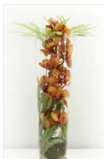
Thekengesteck 10 Glaszylinder Ø 24 cm, Höhe 70 cm, Orchidee