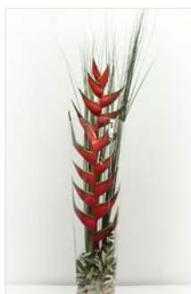
Thekengesteck 09 Glaszylinder Ø 24 cm, Höhe 70 cm, Caribea