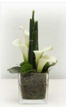
Tischgesteck 17 Glaskubus 12 x 12 cm Höhe 20 cm, Calla