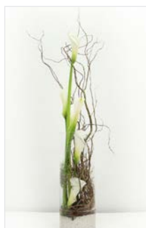
Thekengesteck 11 Glaszylinder Ø 24 cm, Höhe 90 cm, Calla / Äste