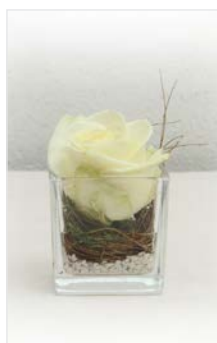
Tischgesteck 01 Glaskubus 10 x 10 cm, Höhe 10 cm, Rose weiß