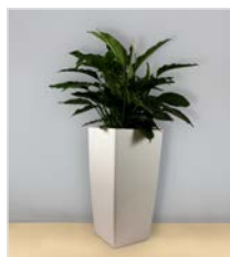
Hochgefäß 10 L 40 x B 40 / H 75 cm – mit Spathiphyllum