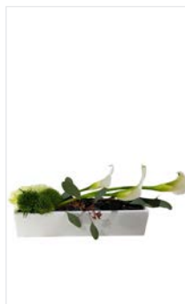
Tischgesteck 09 Keramikvase lang 28 x 6 cm, Höhe 18 cm, Calla weiß