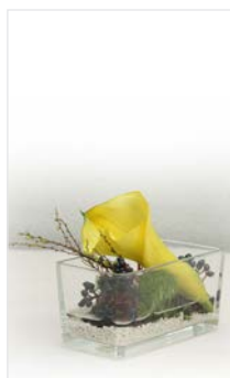
Tischgesteck 14 Glasvase lang 18 x 8 cm, Höhe 15 cm, Calla gelb