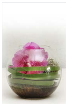
Tischgesteck 12 Glasvase rund Ø 17 cm, Höhe 15 cm, Orchidee