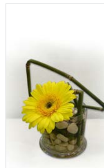
Tischgesteck 10 Glasgefäß Ø 10 cm, Gerbera gelb, Kies natur, Schachtelhalm, Höhe 12 cm