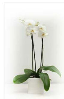
Thekengesteck 14 Kubus, weiß 10 x 10 cm, Höhe 40 cm, Orchidee