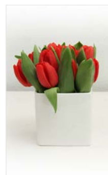
Tischgesteck 04 Kubus weiß 10 x 10 cm, Höhe 10 cm, z.B. Tulpen