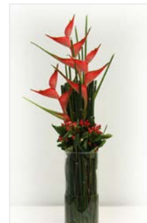
Thekengesteck 08 Glaszylinder Ø 18 cm, Höhe 50 cm, Caribea