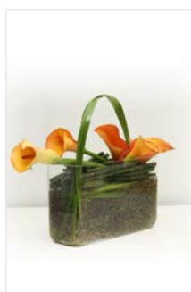
Thekengesteck 16 Glasgefäß lang 15 x 8 cm, Calla orange liegend