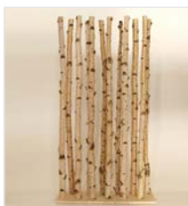
Raumtrenner mit 12 Birkenstämmen natur 6 cm, Gesamthöhe 180