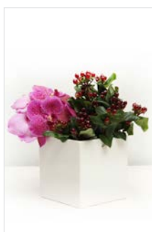
Thekengesteck 15 Kubus, weiß 15 x 15 cm, Höhe 40 cm, Orchidee