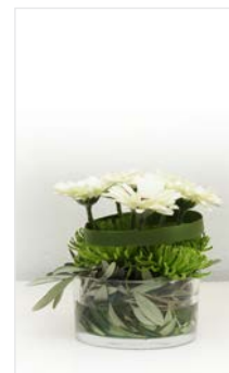
Thekengesteck 02 Glasschale Ø 15 cm, Höhe 20 cm, Gerbera