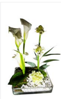
Tischgesteck 06 Glasquader mit Kies, Calla + Ornithogallum weiß, Höhe 30 cm