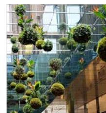
Kokedama – Schwebende Pflanze im Moosball